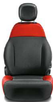
PANDA Tissu rouge / noir