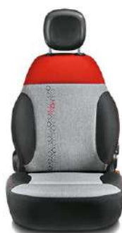
EASY / LOUNGE Tissu rouge / noir Surpiqûres rouges