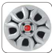
Enjoliveurs 14" De série sur motorisation GNV