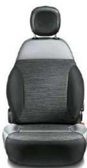
4X4 Tissu gris / Ecocuir gris Surpiqûres vertes