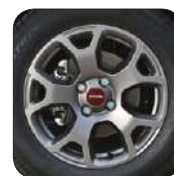
Jantes alliage 15" De série sur City Cross Plus/4x4 Cross