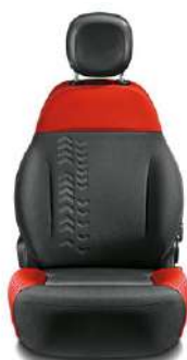
POP / WILD Tissu rouge / noir Surpiqûres grises