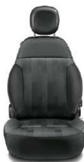
CITY CROSS Tissu gris Surpiqûres grises