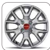
Enjoliveurs 14" De série sur Pop