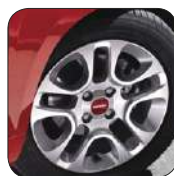
Jantes alliage 14" De série sur Lounge En option sur Pop et Easy