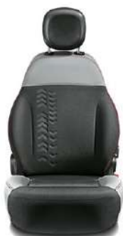
POP / WILD Tissu gris / noir Surpiqûres rouges