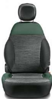
4X4 Tissu gris / Ecocuir vert Surpiqûres grises