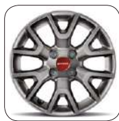
Jantes alliage 15" De série sur 4x4