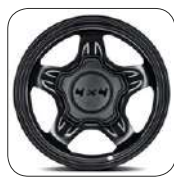
Jantes acier 15" De série sur Wild