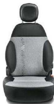
EASY / LOUNGE Tissu gris / noir Surpiqûres grises