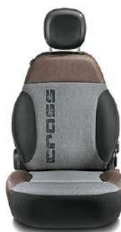
4X4 CROSS / CITY CROSS PLUS Tissu gris / Ecocuir marron cuivré Surpiqûres grises