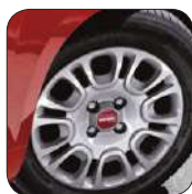
Enjoliveurs 14" De série sur Easy