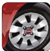
Enjoliveurs 14" De série sur Panda