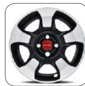
Jantes acier 15" De série sur City Cross